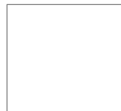
Immagine Incisione (facoltativa)